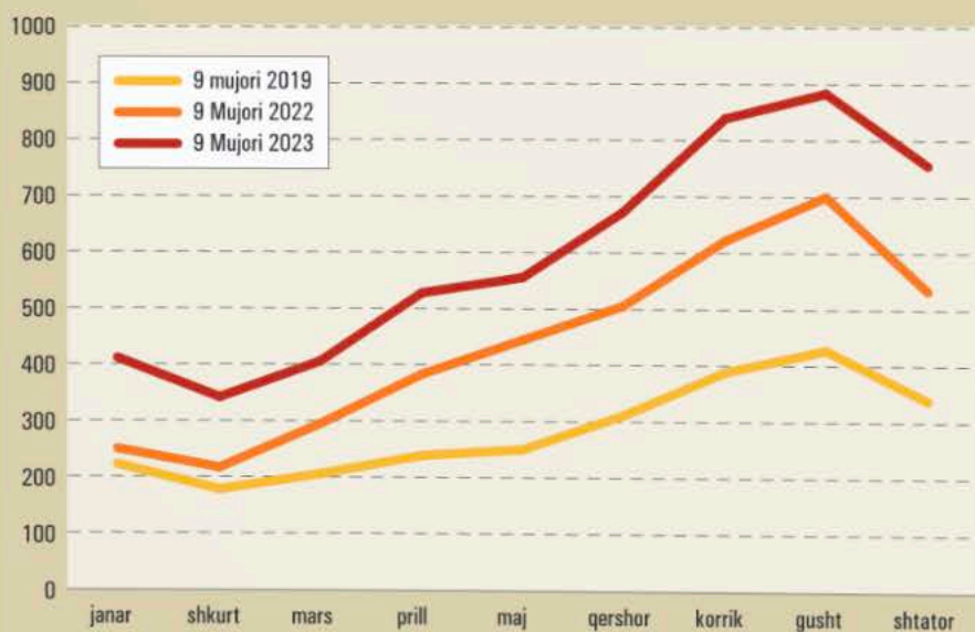
LËVIZJET E SHTETASVE ME AJËR, JANAR-SHTATOR (MIJË)

Ndërtimi i aeroportit të Vlorës do të jetë një zhvillim i mëtejshëm në industrinë e aviacionit dhe atë të turizmit. Ai është një kontribut i çmuar që i shtohet përpjekjeve tona për të çuar Shqipërinë në nivele ndërkombëtare. Nisja e fluturimeve nga dhe drejt Vlorës do të shtojë fluksin e vizitorëve në Shqipëri, dhe për rrjedhojë ndikon pozitivisht edhe për Aeroportin Ndërkombëtar të Tiranës. Fokusi kryesor i këtyre aeroporteve do të jetë rritja dhe përmirësimi i tregut në përgjithësi, duke shtuar kapacitetet në vend. ■